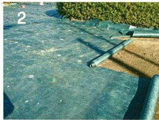
2 グリーンビスタ®を敷詰める 現場の状況に合わせてピン固定する シートの重ねは10cm以上設ける