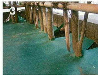
3 状況に合わせてハサミ等でカットする