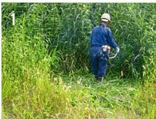
1 施工場所を除草・整地する