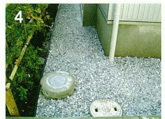
4 グリーンビスタ®の上に玉砂利、砕石等を敷詰める